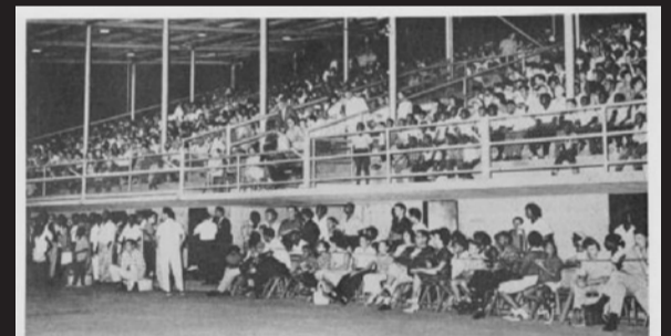
Publico riba 27 di april 1963 den Lago Sport Park pa atende e encuentro deportivo anual. E anochi, un diasbra 7.000 persona a drenta Lago Sport Park.